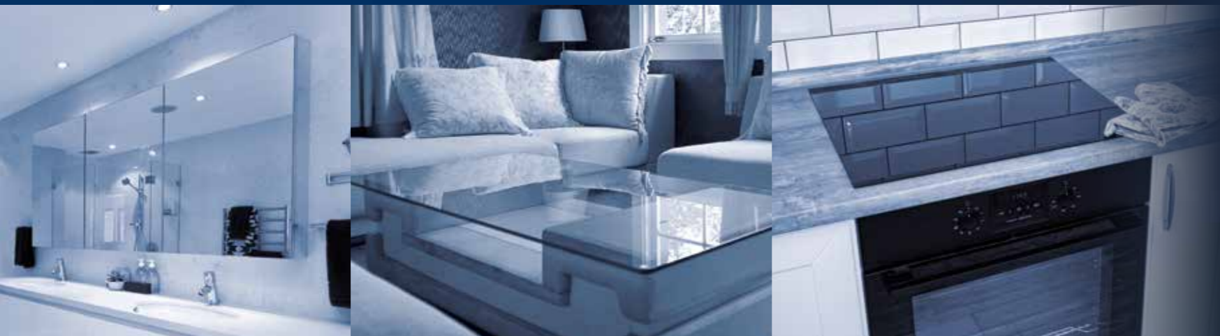
specchi | tavoli | forni e piani cottura

T echnological. O riginal. P erforming solutions.