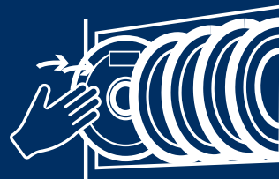
Carico bobina in magazzino