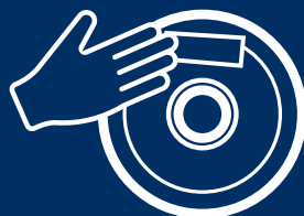
Applicazione etichetta identificativa su bobina