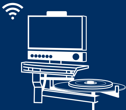
Lavorazione con calcolo consumo bordo