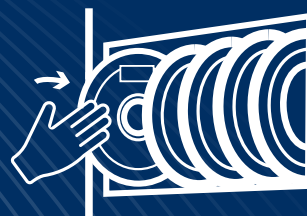
Assegnazione ubicazione magazzino