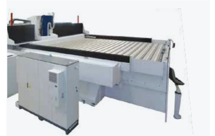
顶部波纹管式封口，可容纳灰尘和切屑