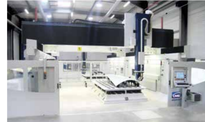
MATRIX UHF工作台 带有即插即用执行器的框架结构。

CMS通用夹紧装置 (UHF) 工作台具有不同配置：水平、立式、倾斜、单轴、多轴式 (包括专利5轴解决方案) 以及与Cronus机床不同型号集成所需的各种尺寸。