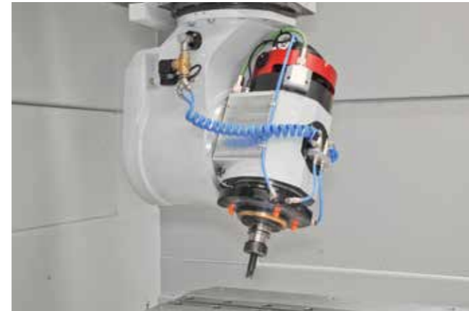
采用直接驱动技术的5轴切割头