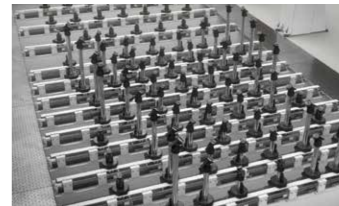
3/5轴 UHF工作台 该系统允许在加工过程中需要最大支撑的区域对执行器和吸盘进行精准定位。