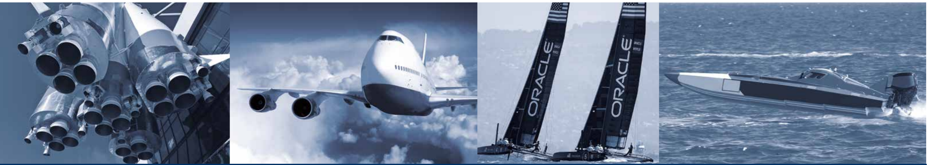
航空航天 | 一级方程式赛车 与赛车运动 | 汽车 | 航海