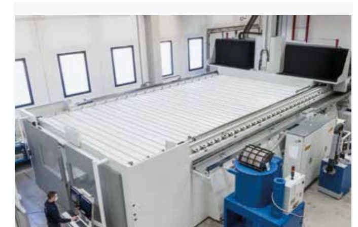
Fermeture supérieure à soufflet pour le confinement des poussières et des copeaux