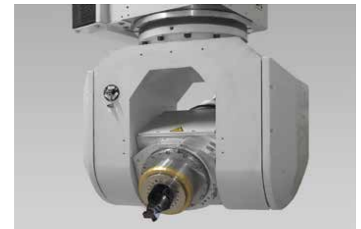
FX5 unité à fourche avec double moteur couple