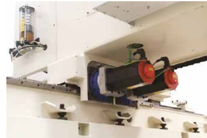
Cinématique avec récupération du jeu électrique (double moteur) pour assurer une plus grande rigidité et précision