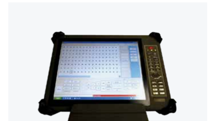
TABLETTE DE CONTRÔLE ET DE GESTION UHF Logiciel de programmation des tables et de contrôle des collisions directement intégré au CAO/FAO