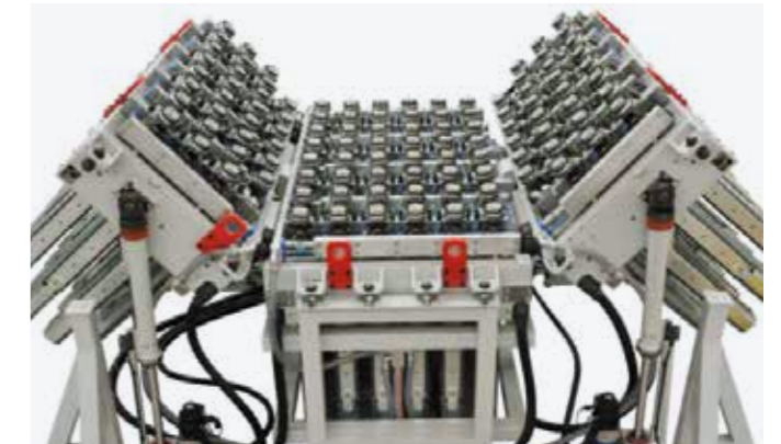
TABLE BASCULANTE UHF La partie centrale de la table est fixe, tandis que les deux ailes latérales peuvent être inclinées jusqu'à 45° ; l'inclinaison est contrôlée par CN. La meilleure solution pour usiner des pièces avec un rayon de courbure minimal