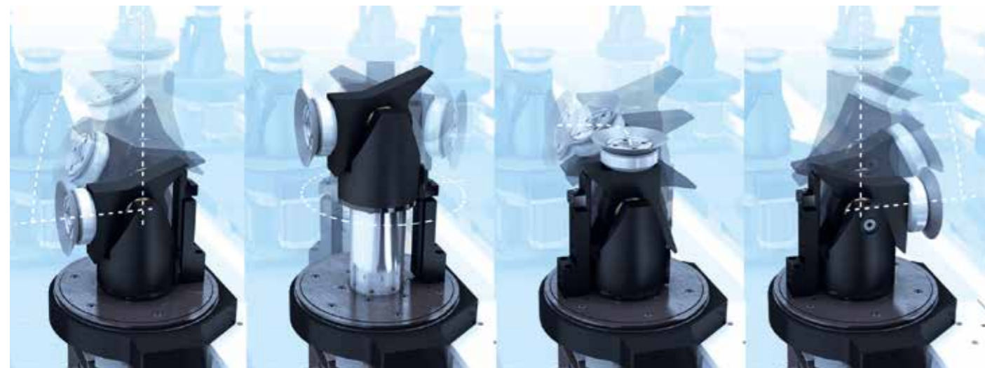
ACTIONNEUR 5X AVEC ORIENTATION DANS L'ESPACE CONTRÔLÉE PAR CN (0-90° / 360°)