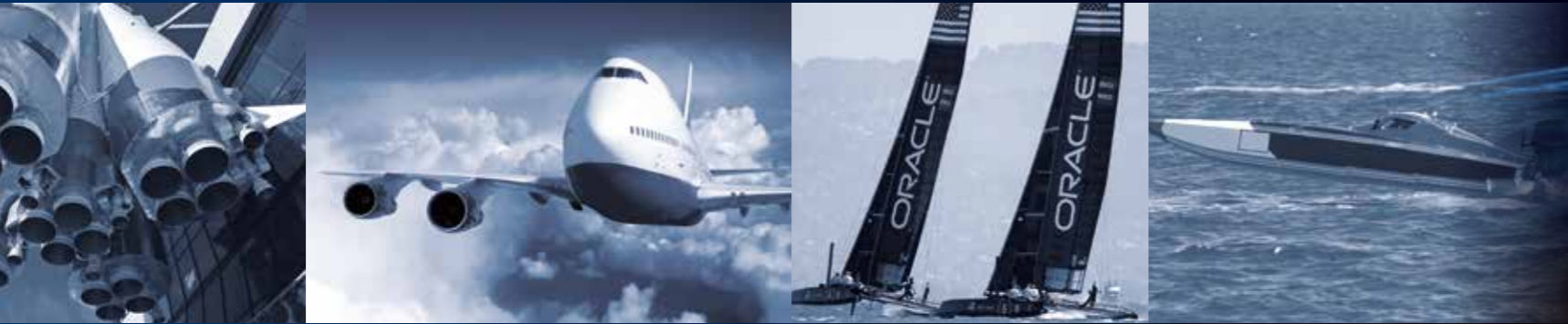
aérospatiale | F1 & motor sport | automobile | nautique