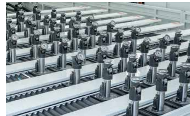
TABLE UHF 3/5 AXES Ce système permet de positionner les actionneurs, et donc les ventouses, où le besoin de support est plus important pendant l'usinage