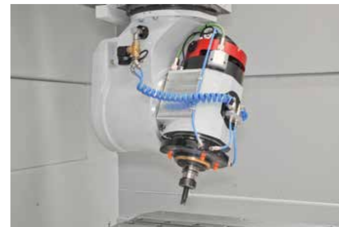
Tête de coupe à 5 axes avec technologie direct drive