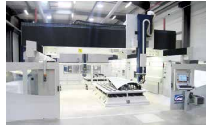
TABLE UHF MATRIX Structure avec actionneurs "plug-and-play"

Les tables UHF (Universal Holding Fixtures) de CMS sont disponibles en différentes configurations : horizontale, verticale, inclinable, mono-axe, multi-axes (y compris une solution à 5 axes brevetée) et dans toutes les tailles nécessaires pour être intégrées aux différents modèles Ethos existants.