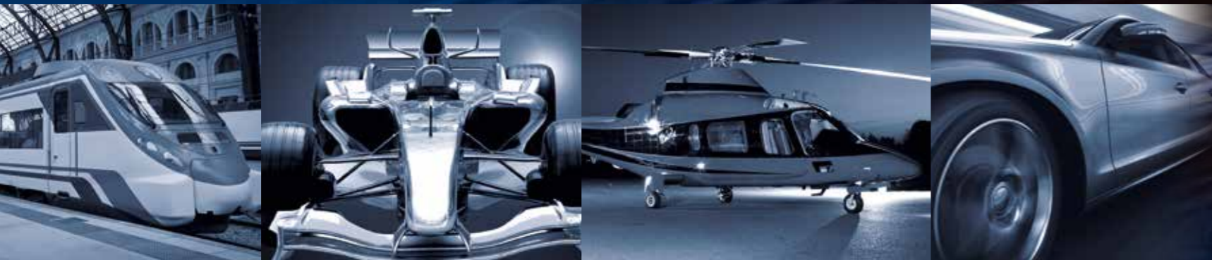
航海 | 防御 | 汽车 | 航空