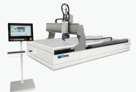
TECNO CUT SMARTLINE