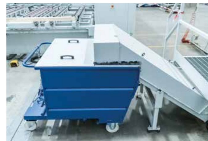
刨花输送机皮带 易于清除灰尘、刨花和碎屑