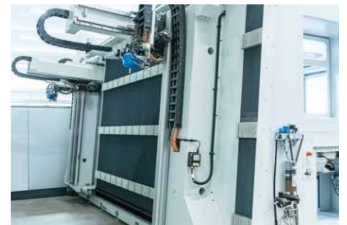
整体机柜 整体机柜配有后部折叠门