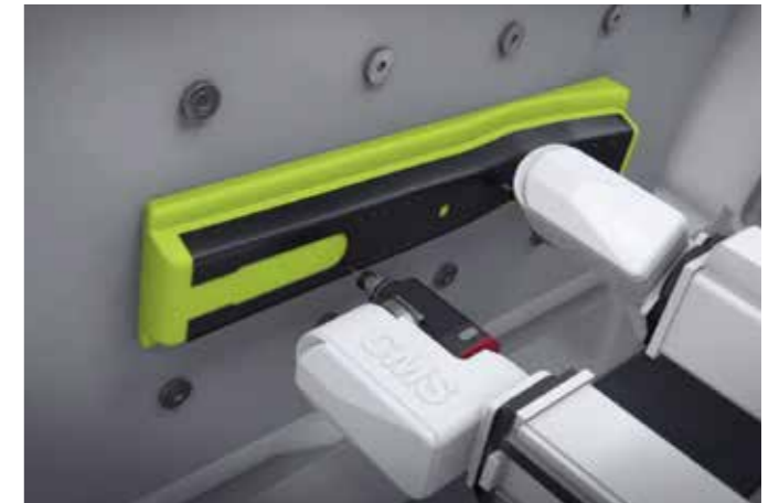
双加工单元 双加工单元同时加工