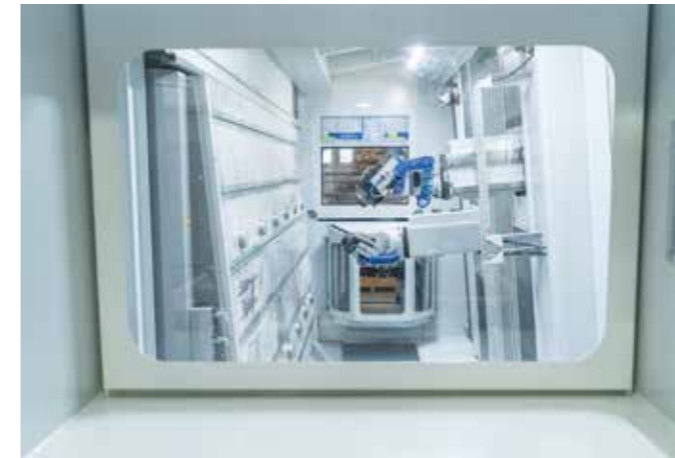
操作员工位 工作区的最佳视野