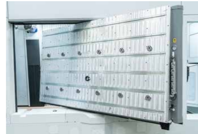
工作台面 工作台面可根据客户需求定制（零点、真空、T型槽...等）