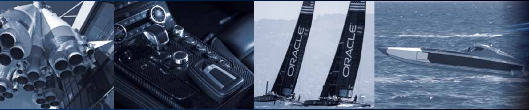
碳纤维部件 | 铝制部件 | F1 与赛车运动