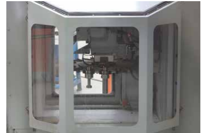
刀库 完全安全的可达性和防尘