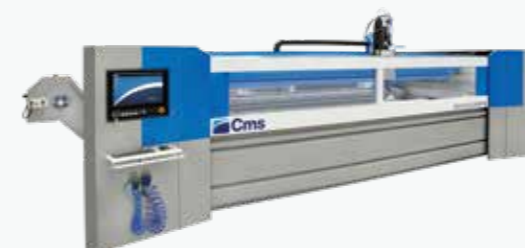
TECNO CUT PROLINE