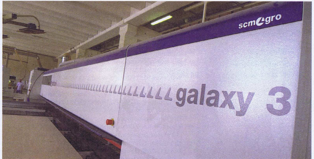
La scie à panneaux Gabbiani Galaxy 3 acquise en 2014.