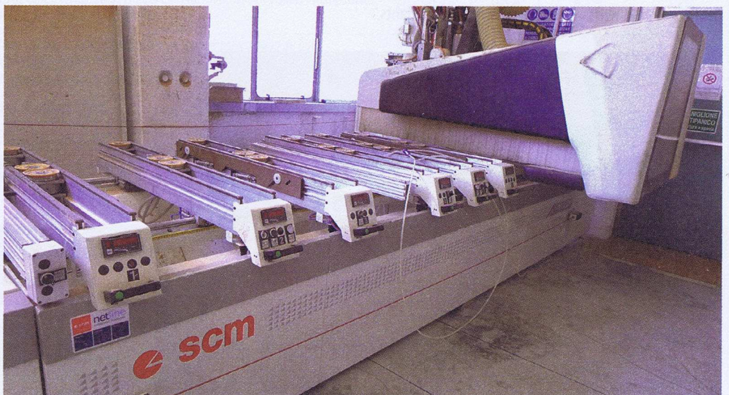
La 3 axes Tech Z30 sera bientôt remplacée par une 5 axes Tech Z5.