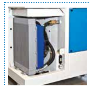
Scambiatore di calore aria/olio