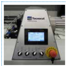
Controllo elettronico della pressione di taglio

Software-based electronic control of cutting pressure