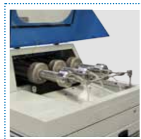
Moltiplicatori di pressione

Software-based electronic control of cutting pressure