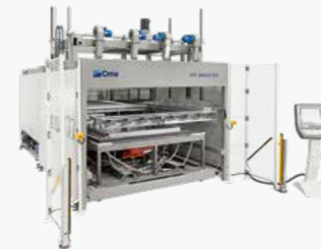
BR5 SPECIAL SPA