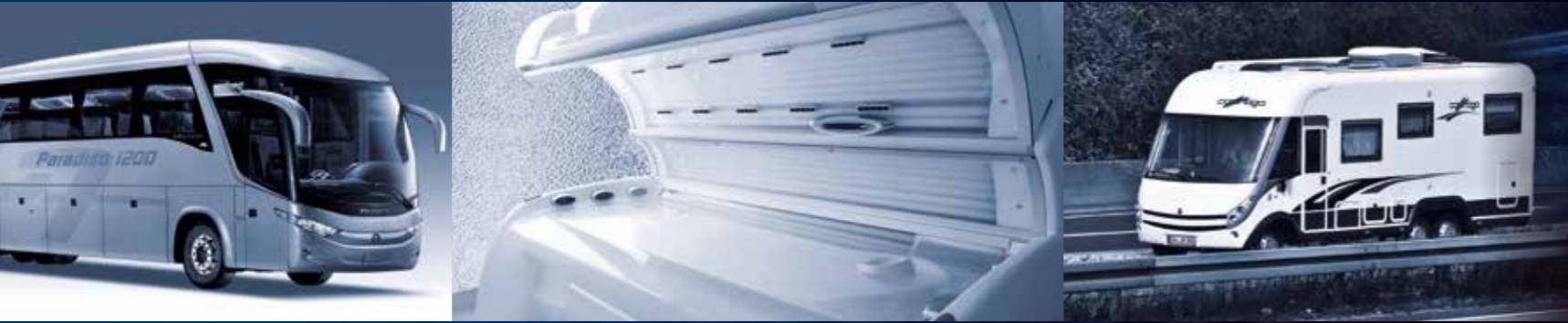
transport de masse | électromédical et esthétique | caravanes | articles sanitaires