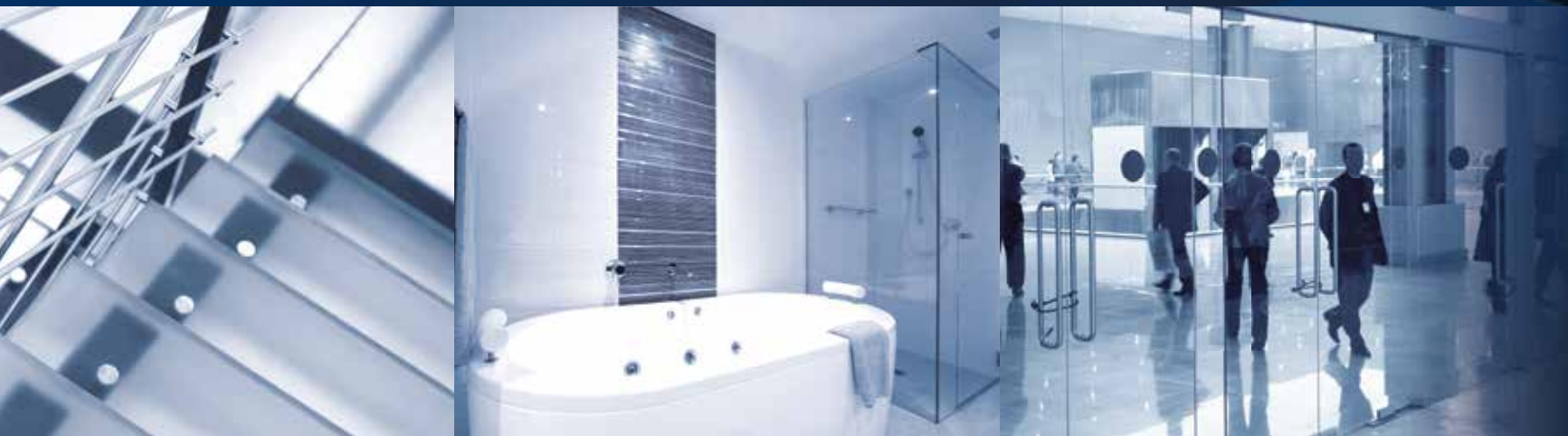
门 | 楼梯 | 浴室台面