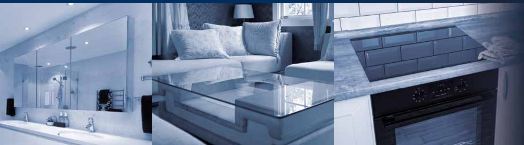
镜子 | 桌子 | 烤炉及灶台