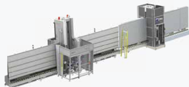
YPSOS型 + VERTEC MILL型