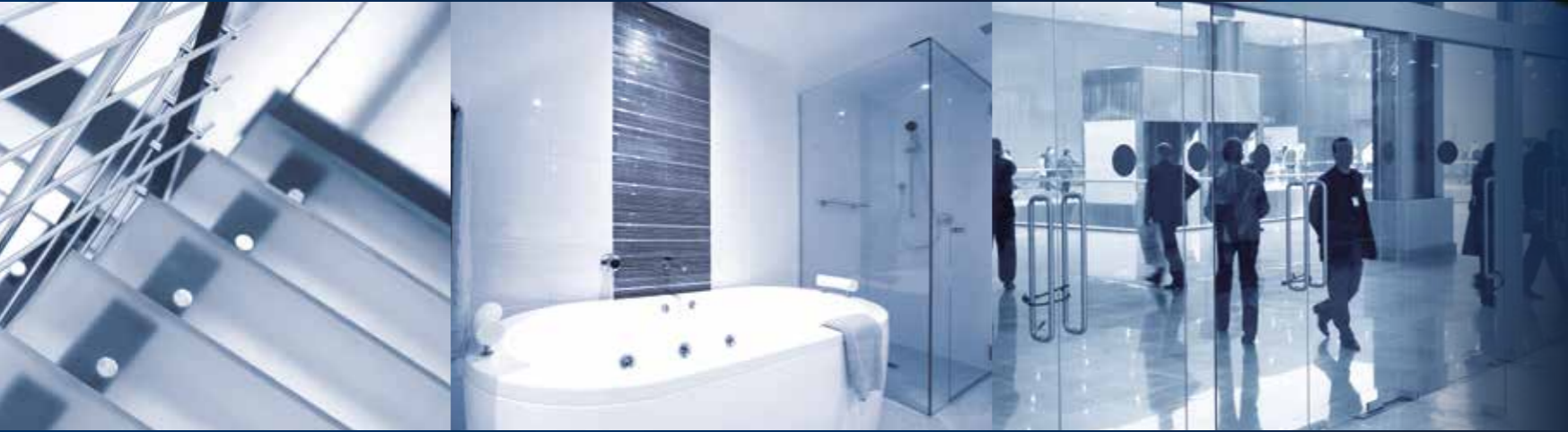
puertas | escaleras | encimeras de baño