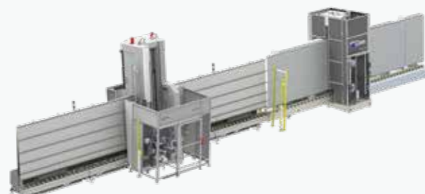
YPSOS + VERTEC MILL