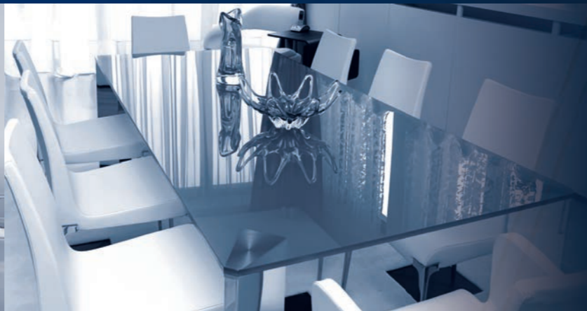
зеркала | душевая кабина | фотогальванический | столы