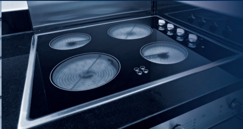
двери | структурные фасады и окна | духовые печи и варочные плиты