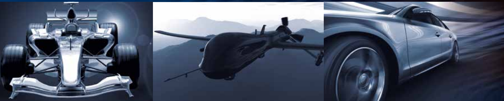
型号 | 航空