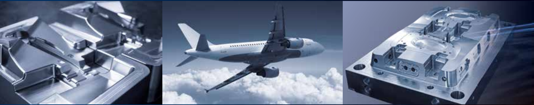
航天 | 一级方程式赛车与赛车运动 | 汽车