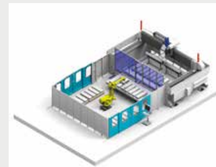
模块化柔性机器人岛，可提高生产力

装载符合人体工程学：智能操作 装载最大程度上符合人体工程学，紧凑的一体式结构和开放式框架，可用于简化已加工工件的装载和卸载操作。