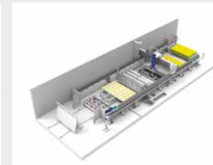
自动装卸系统，永不停运的切割线