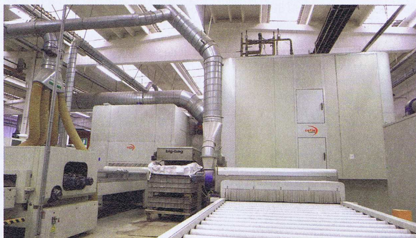
Pour les étapes de finition, une ligne de peinture Cefla.